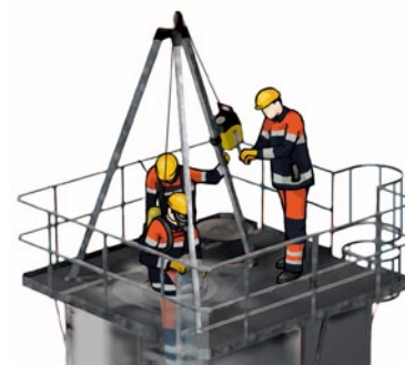
Rys. 2. Asekuracja pracownika